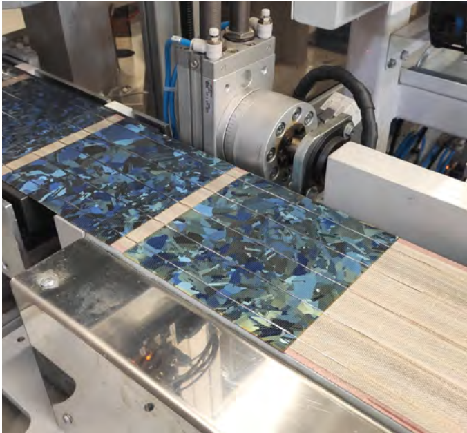
VGS, Production of PV modules.

We develop solutions for photovoltaic applications by using the best-quality components.