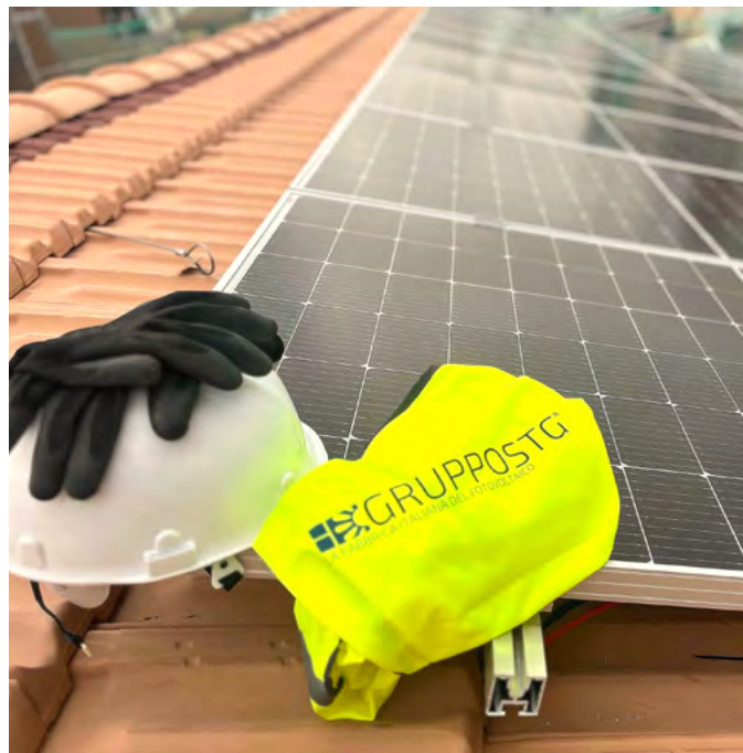
Photovoltaic installation in Milan

The technical and administrative structure of GruppoSTG - PV System Division can count on the high professional value given by the continuous updating and the strong motivation of its staff, able to guarantee the result expected by the customer.