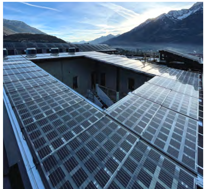
Glass-glass PV plant in Aosta