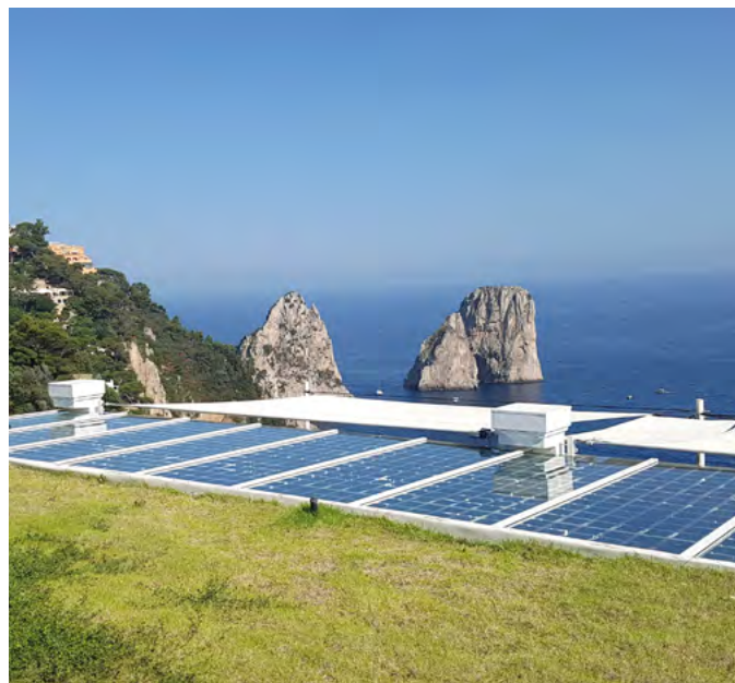
Photovoltaic installation in Capri