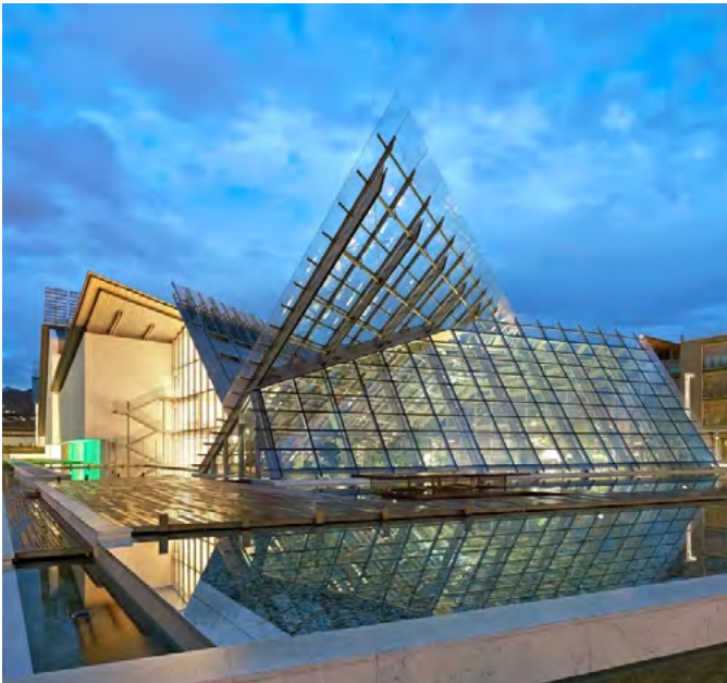
Glass-glass PV plant at MUSE, Trento

Flexibility and customisation freedom in terms of measurements, power, transparency and colours allow for harmonious continuity of construction elements in the building envelope.