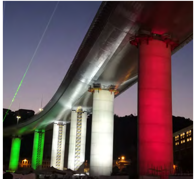
San Giorgio Bridge, Genoa