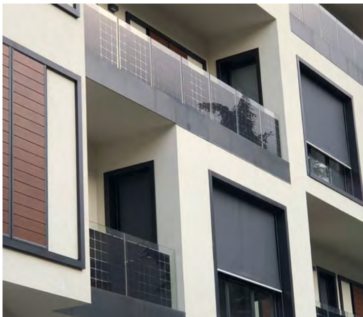
PV Balcony in Milano