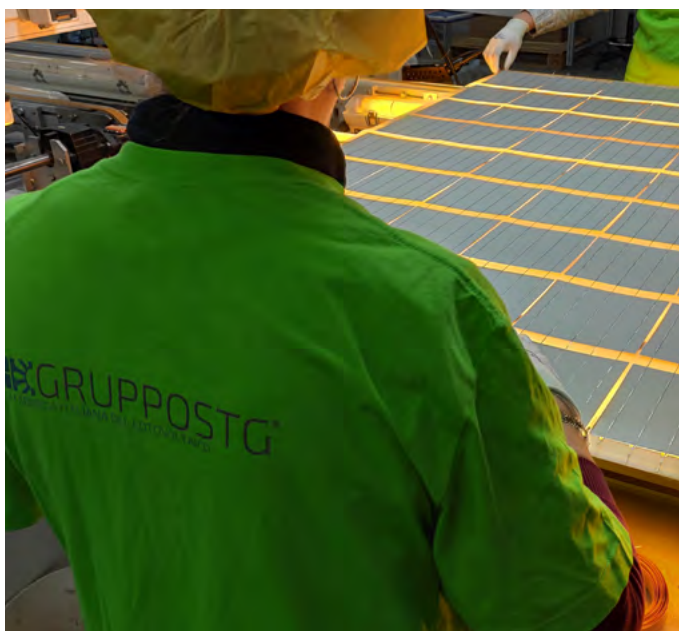
Glass PV production.

GruppoSTG dal 2009 è una realtà Italiana specializzata nella progettazione e produzione di soluzioni fotovoltaiche e strutturali. Ispirato ai principi dello sviluppo sostenibile e coinvolto nello studio e nell'applicazione di nuove tecnologie d'avanguardia finalizzate al risparmio energetico, il GruppoSTG si è consolidato, diventando un partner affidabile e competente, in grado di garantire un approccio integrato di soluzioni energetiche per l'edificio.