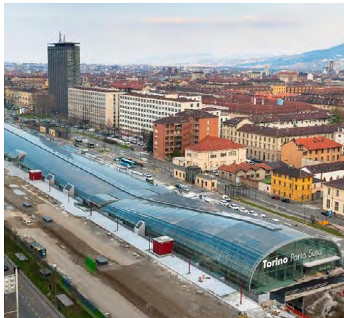
Glass-glass PV plant in st. Porta Susa, Torino.