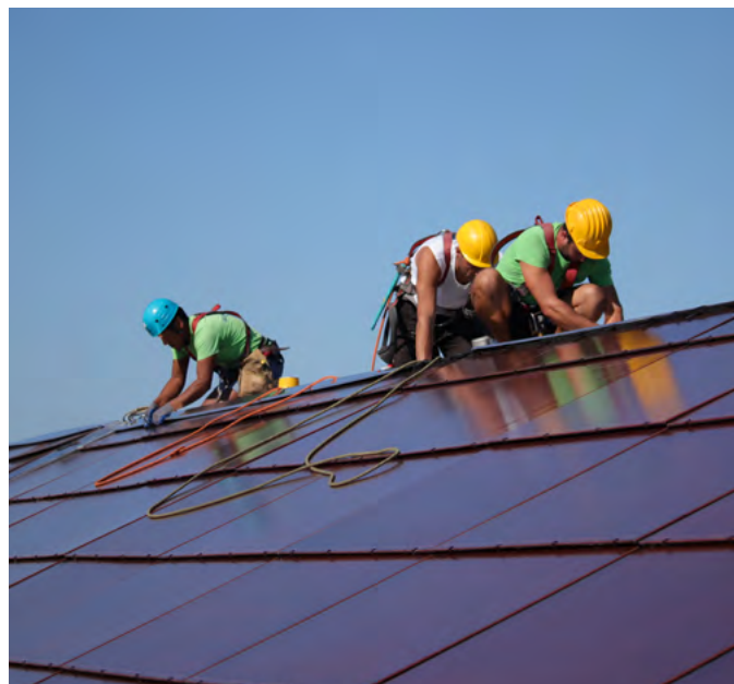
Photovoltaic installation in Venezia

La struttura tecnica ed amministrativa di GruppoSTG - Divisione impianti fotovoltaici può contare sull'elevato valore professionale dato dal continuo aggiornamento e la forte motivazione del proprio Staff, in grado di garantire il risultato atteso dal Cliente.