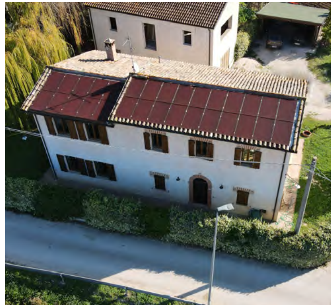
Colored PV plant in Campello sul Clitunno (UNESCO site)